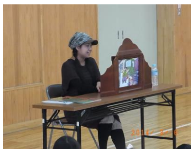
声優さんによる紙芝居上演