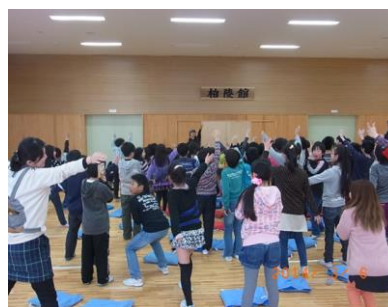
紙芝居の合間には全員参加のゲームも実施