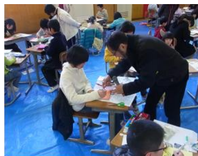
一人ひとりの個性を引き出す指導を行った