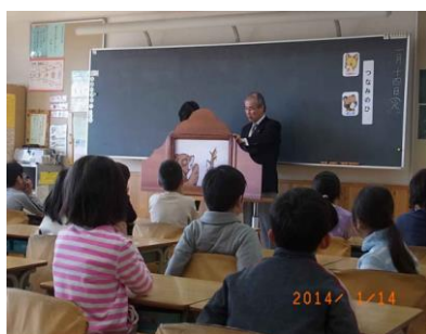
二人（講師と職員など）一組で朗読