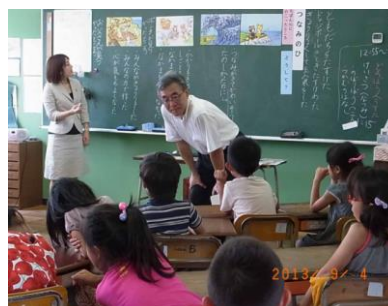
子どもたちに助け合いの大切さを知らせた