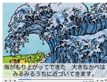
ホームページ上で紙芝居「つなみのひ」も閲覧できる