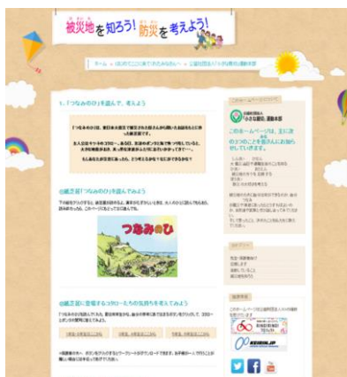
子ども、先生方を対象にしたホームページ

被災地情報のほか、③の事業内容を子どもだけでも学習してもらえるよう、ワークシートを掲載。また小学校で先生方に自ら授業を行ってもらえるよう、全学年に対応した学習指導案を掲載。